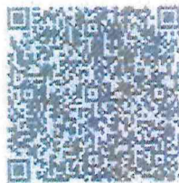
ใบแจ้งการชำระเงิน