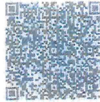
รายชื่อเจ้าหน้าที่ประสานงาน