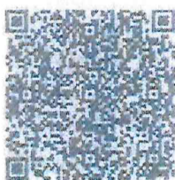
กำหนดการโครงการ