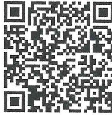
สแกน QR Code สมัครอบรม